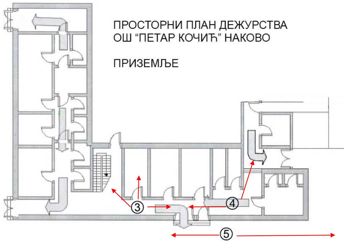
ПРОСТОРНИ ПЛАН ДЕЖУРСТВА ОШ “ПЕТАР КОЧИЋ” НАКОВО